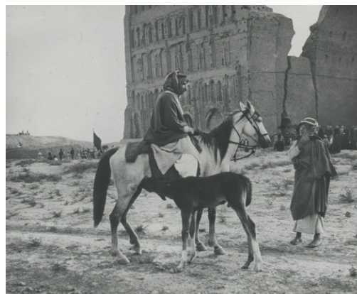
Uit onze collectie glasdijs: "Ktesiphon, voor den groten boog". Meer informatie op www.nino-leiden.nl/collections/nino-collection-glass-slides

De kerntaak van het nieuwe NINO is het bevorderen van wetenschappelijk onderzoek. Voor publieksactiviteiten werken wij samen met ervaren en actieve partners, zoals het RMO en Ex Oriente Lux. Met deze laatste partner zal NINO voortaan twee activiteiten per jaar organiseren (voor het eerst in najaar 2018). Zoals in het verleden, is RMO onze partner bij de organisatie van onder meer de Veenhof- en Sancisi-lezingen. Andere stichtingen en studieverenigingen zijn welkom om bij het NINO kleine subsidies aan te vragen voor de organisatie van activiteiten die een niet-