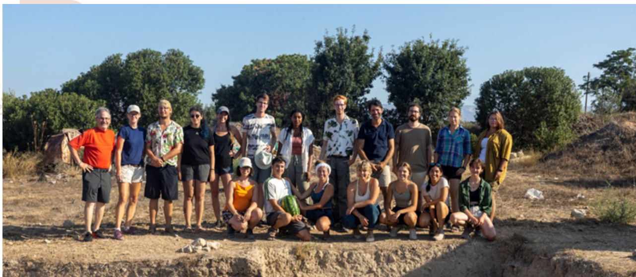
Team van Palloures 2021, eerste 3 weken.

Het meest spectaculaire resultaat van het seizoen was de opgraving van een huis vol met complete voorraadpotten. We schatten dat er ca. 40 aanwezig waren bovenop mooie pleister vloeren, een haard, en allerlei maalstenen. Deze objecten lagen deels in een aspakket, wat er op lijkt te wijzen dat het gebouw in de brand gestaan heeft en mogelijk daardoor ingestort is. Bijzonder was de vondst van een verbrande balk op de vloer. Deze balk zal binnenkort worden geanalyseerd door een dendro-chronoloog (een specialist die aan de hand van de jaarringen heel precies kan bepalen wanneer de boom heeft geleefd), en we hopen daarmee een heel precieze datering van dit gebouw te krijgen.