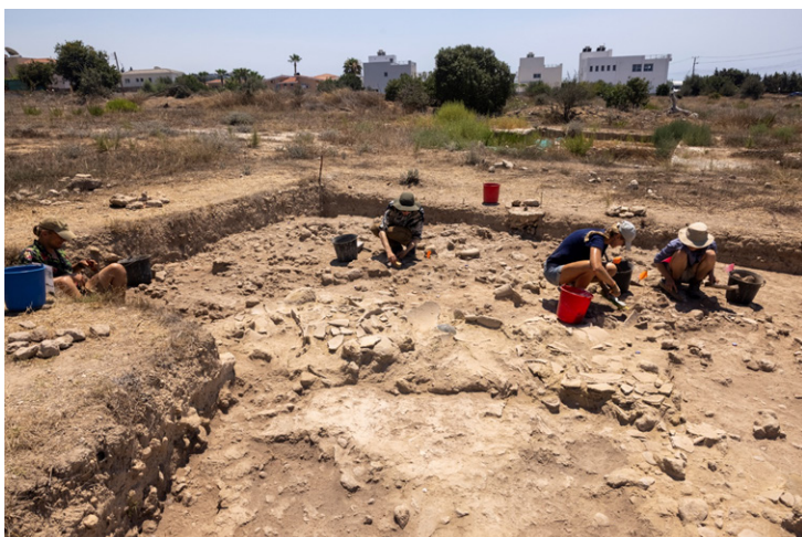
De opgraving van de voorraadpotten.

Dit soort contexten zijn voor archeologen natuurlijk heel spannend, omdat we kunnen reconstrueren wat de capaciteit is geweest van de voorraadpotten, en we mogelijk iets kunnen zeggen over wat er in de potten zat. Om dat te achterhalen hebben we heel veel monsters genomen rondom deze potten voor onderzoek naar botanische resten zoals zaden en planten, en voor onderzoek naar phytolithen, microscopische silica overblijfselen van planten. Het opgraven van de verrommelde (ingestorte en verploegde) assemblages was een mooie uitdaging waar we veel technologische snufjes voor hebben gebruikt, met onder andere 3D-fotografie en de documentatie van elke individuele scherf.