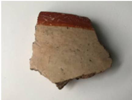
Voorbeeld van een 'Red-on-White' scherf van Chlorakas-Palloures met een rode decoratiestreek aan de bovenrand.

zogenaamde 'Red Monochrome' aardewerk. In een ander geval is er een witte sliplaag aangebracht met daarover een rode laag ter decoratie, wat 'Red-on-White' aardewerk wordt genoemd. Dit zijn enkel een aantal voorbeelden van de vele eigenschappen die moesten worden ingevoerd.