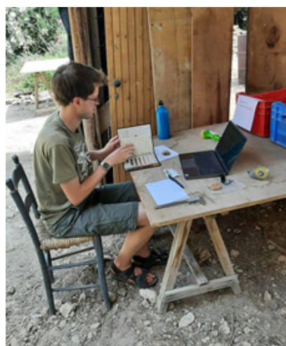
Aan de slag met het bekende 'Munsell Soil Color'-boek om de juiste kleur van het aardewerk te bepalen.