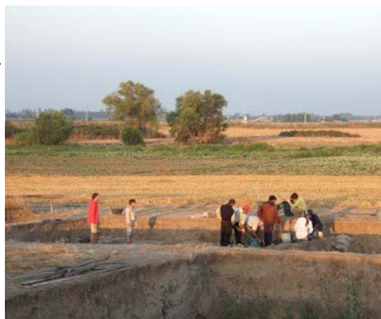
Opgraving Barcın Höyük 2008