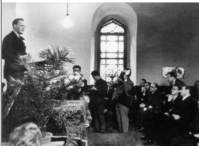
Opening door ZKH Prins Bernhard, 31 maart 1958

In Nederland werd het lustrum op 22 november gevierd met een symposium met als titel 'Het Oude Anatolië'. Een viertal lezingen over belangrijke Nederlandse en buitenlandse onderzoeksprojecten (prehistorische boeren in Noordwest Anatolië, de Hethietische hoofdstad Hattusha, de beelden en tumulus op de Nemrut-berg, en Troje) werd voorafgegaan door een historische schets van 50 jaar instituut door Fokke Gerritsen. Vanzelfsprekend werden daarbij de bezoeken door Prins Bernhard in 1958 en door Koningin Beatrix in 2007 gememoreerd. In Nederland werd het lustrum op 22 november gevierd met een symposium met als titel 'Het Oude Anatolië'. Een viertal lezingen over belangrijke Nederlandse en buitenlandse onderzoeksprojecten (prehistorische boeren in Noordwest Anatolië, de Hethietische hoofdstad Hattusha, de beelden en tumulus op de Nemrut-berg, en Troje) werd voorafgegaan door een historische schets van 50 jaar instituut door Fokke Gerritsen. Vanzelfsprekend werden daarbij de bezoeken door Prins Bernhard in 1958 en door Koningin Beatrix in 2007 gememoreerd.