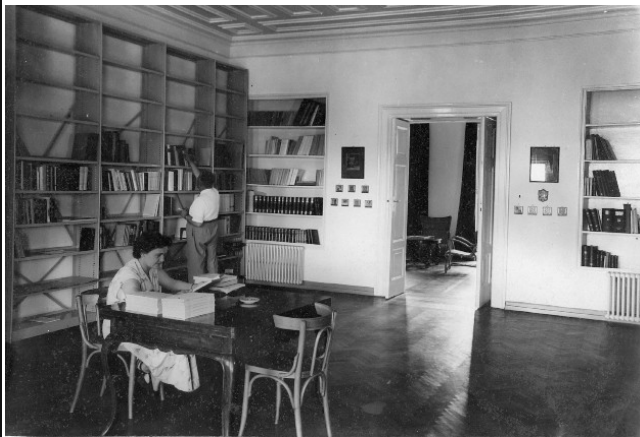
De eerste boeken zijn gearriveerd!