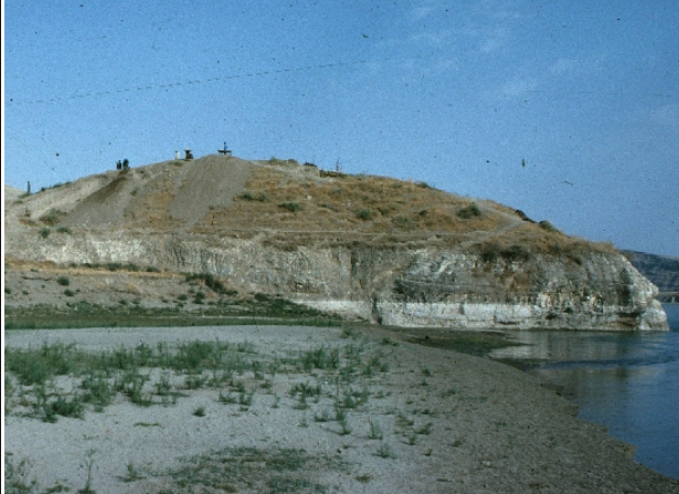
Opgraving Hayaz Höyük 1979-1981