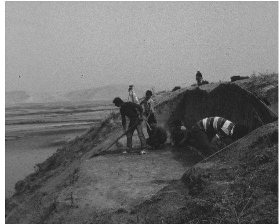
Opgraving Kumartepe 1983