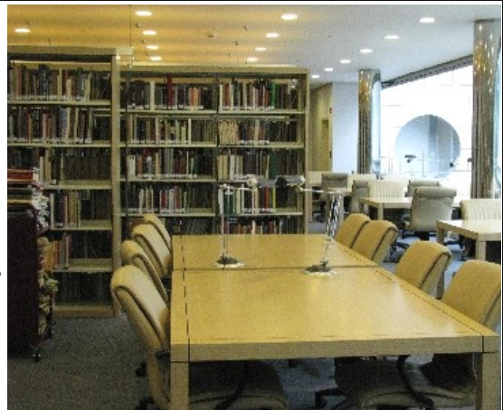
Reorganisatie en nieuwe situatie zomer 2008

Een volgende stap is om een koppeling tot stand te brengen met de online catalogi van de Nederlandse instituten in Rome en Athene, die sinds enige tijd al tegelijkertijd doorzoekbaar zijn ( klik hier ). Het plan is om op den duur alle bibliotheekcatalogi van de Nederlandse instituten rond de Middellandse Zee met elkaar te verbinden.