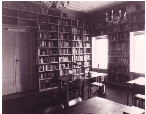
De bibliotheek rond 1980

ga naar: begin - NIT 50 jaar - boekenschenken - Barcın Höyük 2008 - onderzoek Uslu - afscheid Kiel - prijswinnaars - catalogus online - symposia en lezingen