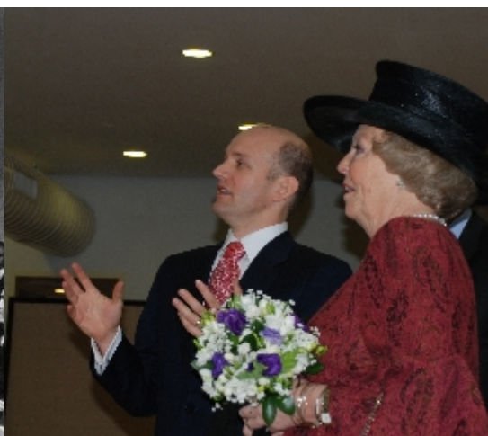
Bezoek HM Koningin Beatrix, 2 maart 2007